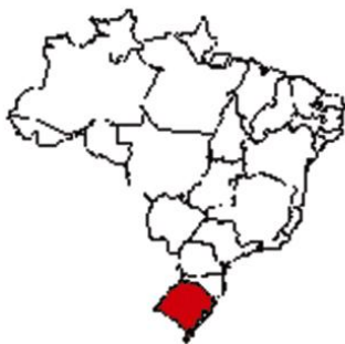
Rio Grande do Sul